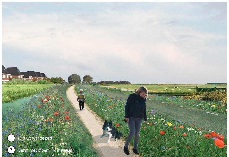
1 Gralux wandelpad 2 Berm met bloemrijk mengsel