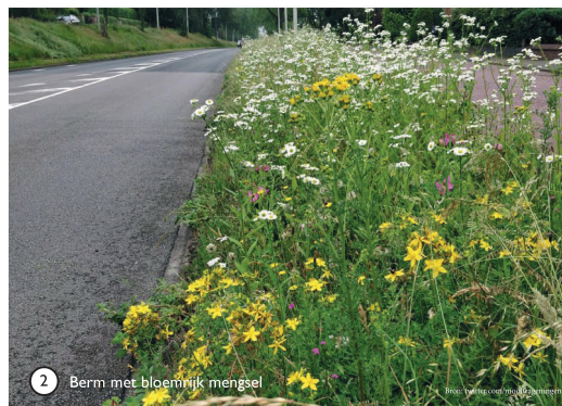
2 Berm met bloemrijk mengsel

Gralux is het natuurlijke, okergele half-verhardingsmateriaal vervaardigd uit fijnste dolemietgesteenten. Opgebouwd uit korrels met een maximale diameter van 10 mm. kenmerkt het product zich door een hoge stabiliteit en goede waterdoorlatende eigenschappen.